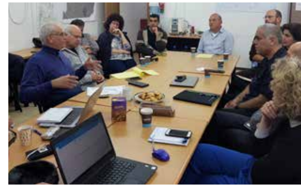
תמונה מתוך פגישה של האשכול במשרד החקלאות בהשתתפות המשרד להגנת הסביבה ותאגדי המים והביוב באזור - מטרתה מציאת פתרון לפסולת העקר, הפסולת שמיצרת בתהליך ייצור שמן הזית.