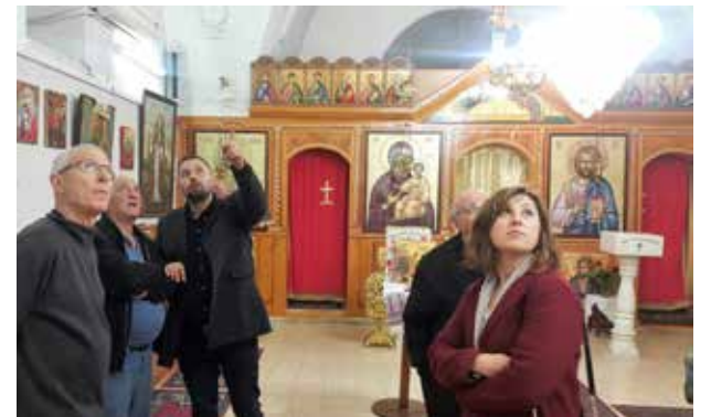
מפגש פורום התיירים בכנסיית בורבארה, בענה