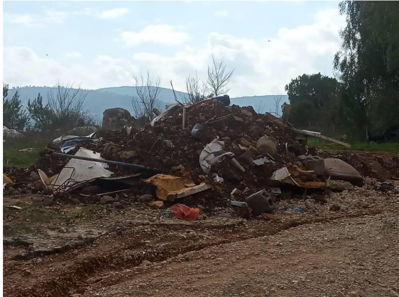
5. נחל שגב

אשכול יישובי בית הכרם בע"מ – מכרז פומבי מס' 10/2020 איסוף, פינוי ושינוע פסולת בניין ושיקום מצבורי פסולת בשטח שיפוט של המועצה האזורית משגב