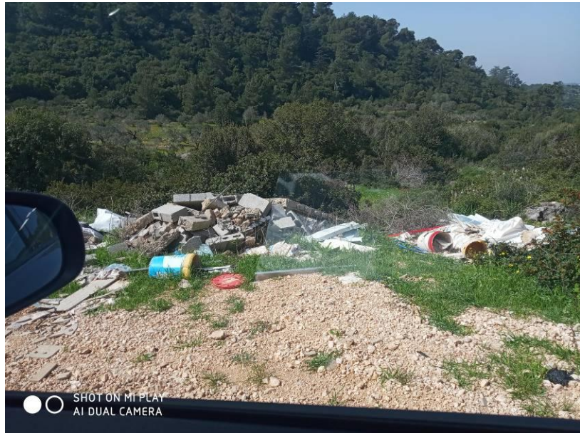
14. מתחת למעבר כביש שעולה לצומת גילון

אשכול יישובי בית הכרם בע"מ – מכרז פומבי מס' 10/2020 איסוף, פינוי ושינוע פסולת בניין ושיקום מצבורי פסולת בשטח שיפוט של המועצה האזורית משגב